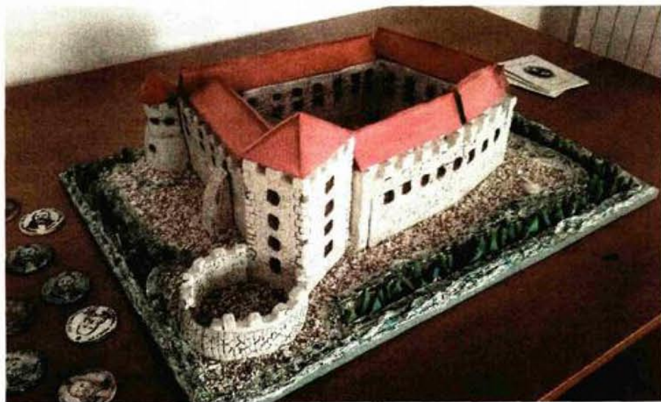
Maketu kaštela iz 13. stoljeća izradili članovi povijesne grupe OŠ Ivana Mažuranića

U prvi kat kule Turnac ulazi se s prvog kata kaštela na kojem je smještena gradska uprava, u drugi kat s drugog kata kaštela. Na treći i četvrti kat te današnji vidikovac dolazi se stepenicama s drugog kata. Od 1972. godine u prostoru drugog kata jugoistočnog krila kaštela i kuli Turnac (drugi, treći i četvrti kat) smješta se novljanski muzej sa svojim stalnim postavom. Na vrhu kule nalazio se panoramski dalekozor. Hodnike i prostorije krasili su brojni muzejski eksponati. Osamdesetih godina prostor kule morao se isprazniti od eksponata zbog vlage i od tada se ne koristi za izlaganje, a već više od deset godina ne koristi se niti vidikovac. Uredjenje kule otvorit će novu mogućnost i ideje, a konačni odgovor što će se naći u kuli ovisit će i o odluci kakvu će namjenu dobiti kuća Mažuranića koja se sljedeće godine vraća gradu.