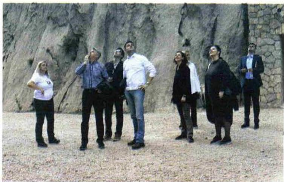
Uživali su u pogledu na kanjon Velike Paklenice