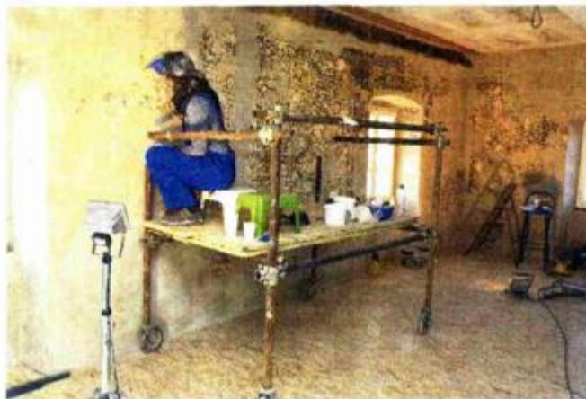
Ovako je to izgledalo u siječnju...