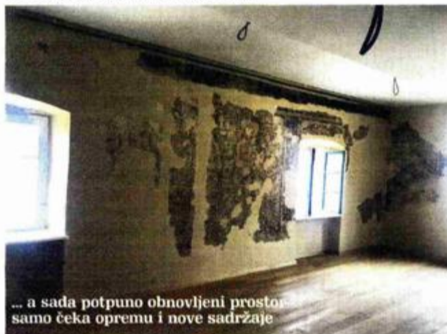
... a sada potpuno obnovljeni prostor samo čeka opremu i nove sadržaje

zapošljavanje dvoje ljudi, što je minimum za funkcioniranje palače, dok će se sa širenjem programa koji će se u tom zdanju izvoditi, i broj zaposlenika povećavati. Programe će izvoditi zaposlenici riječkog Sveučilišta, koji će biti i zaduženi za funkcioniranje palače, a jedna od glavnih aktivnosti bit će i osmišljavanje programa koji će se prijavljivati na fondove kako bi palača Moise bila financijski održiva.